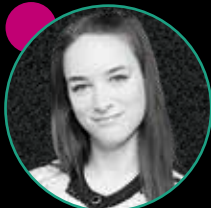
CORNELIA GROISS FACTORY Magazin