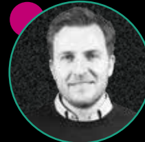
BENJAMIN REICHENECKER PARTSCLOUD