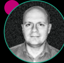
FRANK HOFFMANN Institut für Korrosions- schutz Dresden